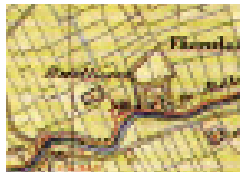
Topografische Kaart 1850