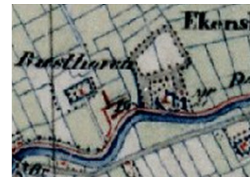
Topografische Militaire Kaart 1830 - 1850