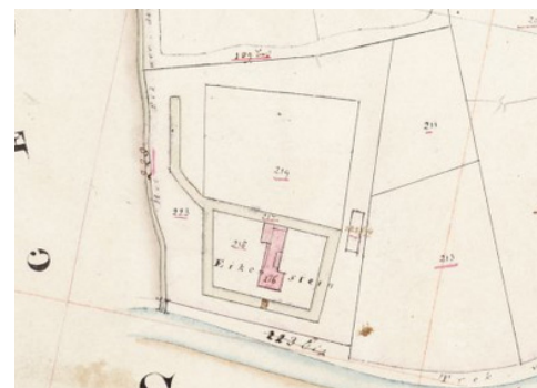
Kadastraal minuutplan 1811 - 1832