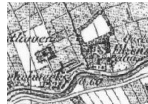
Topografische Militaire Kaart 1850 - 1864