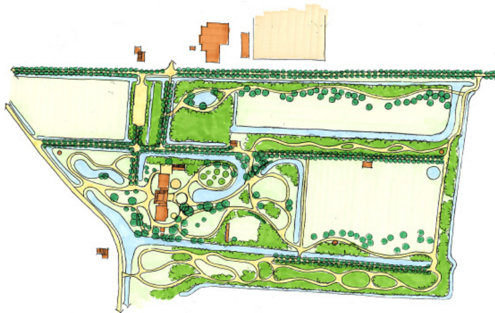
Reconstructie tekening N0.ORDPEIL (2003)