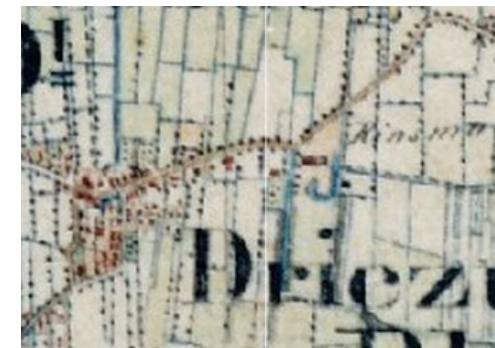
Topografische Militaire Kaart 1830 - 1850