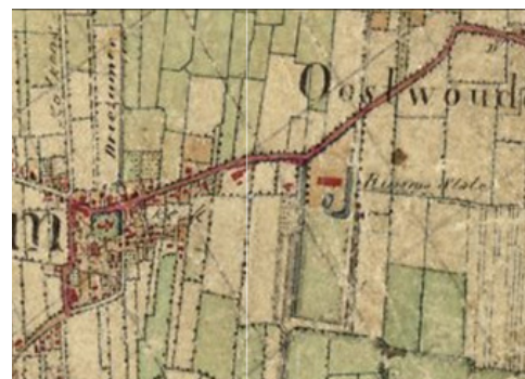
Topografische Militaire Kaart 1854