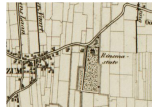
Atlas Eekhoff 1849 - 1859