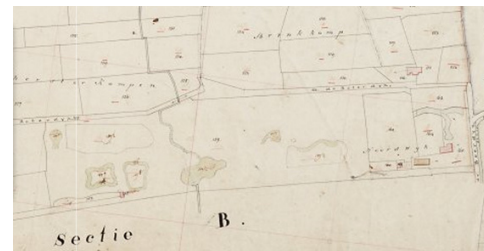
Kadastraal minuutplan 1811 - 1832