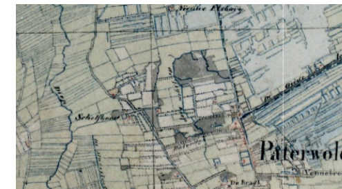
Topografische Militaire Kaart 1830 - 1850