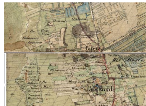
Topografische Militaire Kaart 1853