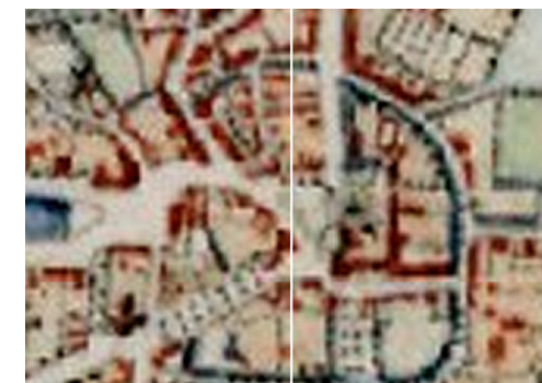
Topografische Militaire Kaart 1830 - 1850