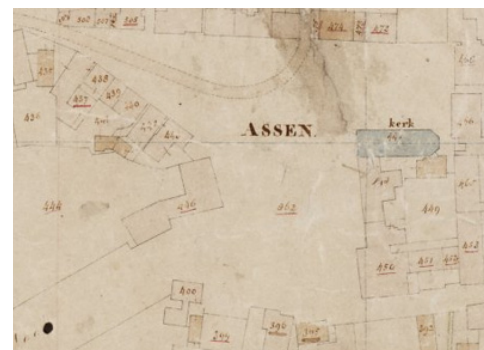
Kadastraal minuutplan 1811 - 1832

De aanleg van het openbaar park kan geplaatst worden in een reeks van ingrepen in de stad die als doel hadden om het aanzien van Assen te vergroten. Er is geen ontwerp bekend, maar historisch kaartmateriaal geeft een fraaie landschappelijke aanleg weer. De openbare groene ruimte is afgebeeld en wordt geflankeerd door voorname gebouwen. De ruimte bestaat uit een samenspel van paden en bolvormige perken. De perken zijn gevarieerd beplant, waarbij op veel plekken ruimte is gegeven voor solitaire bomen. De Brink bestaat nog altijd, maar is sterk gewijzigd.