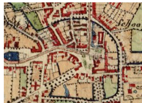
Topografische Militaire Kaart 1852