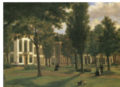
Gezicht op de brink in 1860, schilderij van GL Kiers