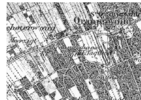
Topografische Militaire Kaart 1850 - 1864