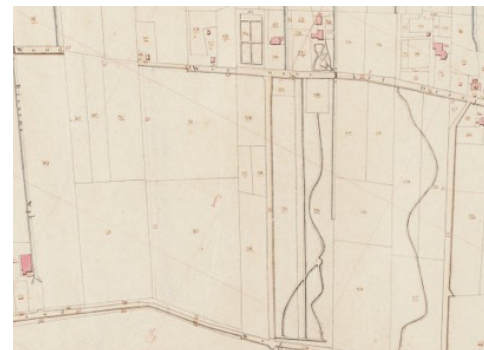
Kadastraal minuutplan 1811 - 1832