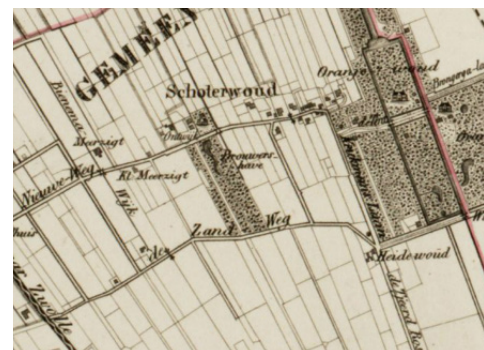
Atlas Eekhoff 1849 - 1859