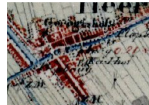
Topografische Militaire Kaart 1830 - 1850