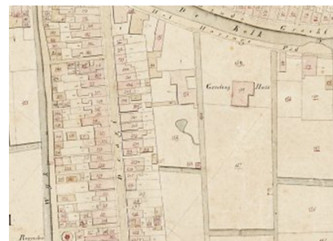
Kadastraal minuutplan 1811 - 1832