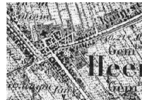
Topografische Militaire Kaart 1850 - 1864