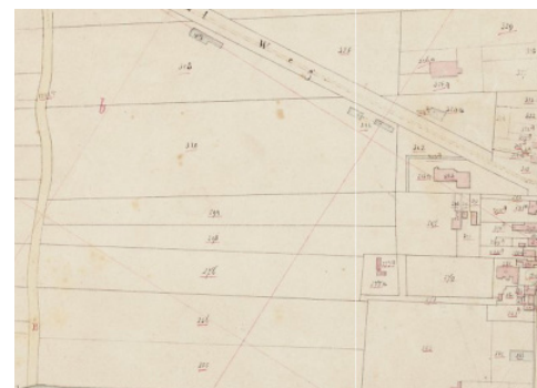
Kadastraal minuutplan 1811 - 1832