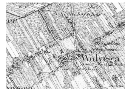
Topografische Militaire Kaart 1850 - 1864