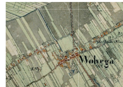
Topografische Militaire Kaart 1830 - 1850