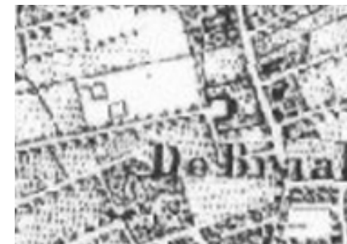
Topografische Militaire Kaart 1850 - 1864