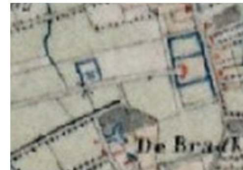
Topografische Militaire Kaart 1830 - 1850