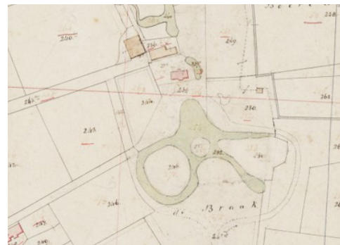
Kadastraal minuutplan 1811 - 1832