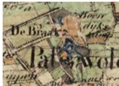
Topografische Militaire Kaart 1852