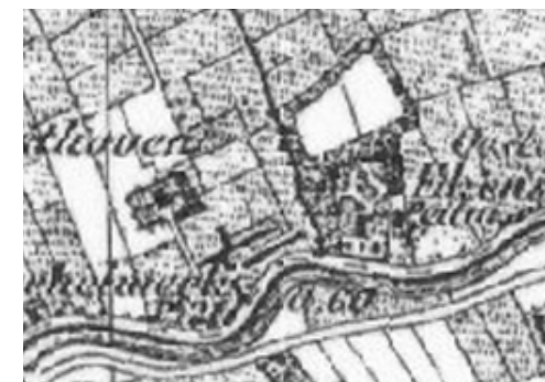
Topografische Militaire Kaart 1850 - 1864