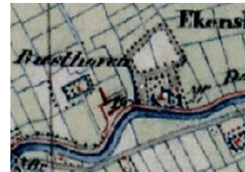
Topografische Militaire Kaart 1830 - 1850