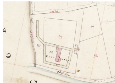
Kadastraal minuutplan 1811 - 1832