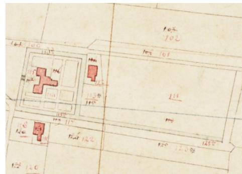
Kadastraal minuutplan 1811 - 1832